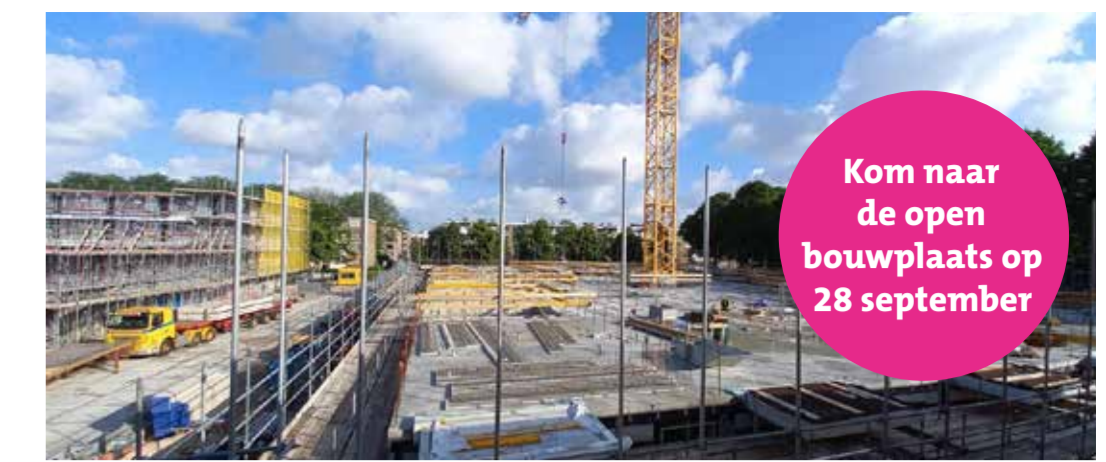
Steenzicht in aanbouw