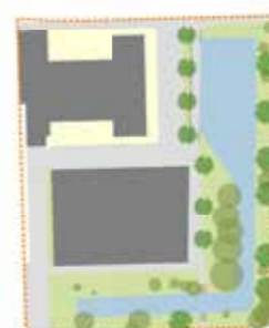
Schetsontwerp openbare ruimte en sportpark Escamp I